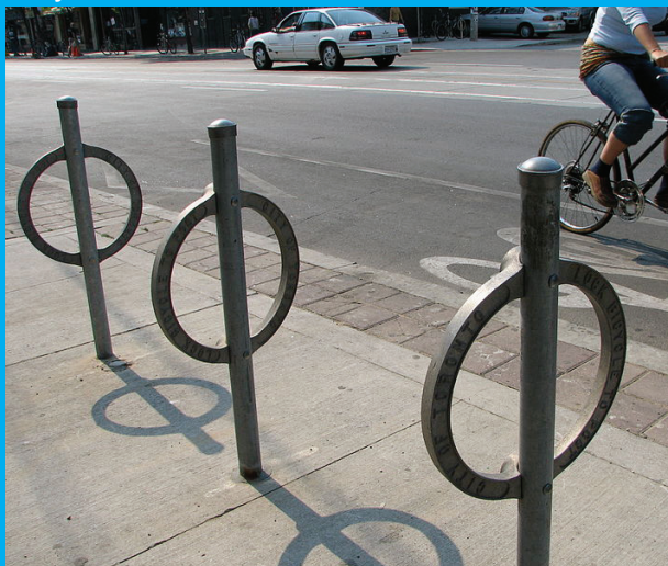
Stojan s kruhom: